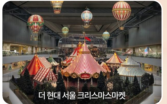
더 현대 서울 크리스마스마켓