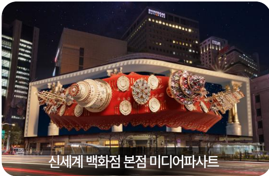
신세계 백화점 본점 미디어파사드