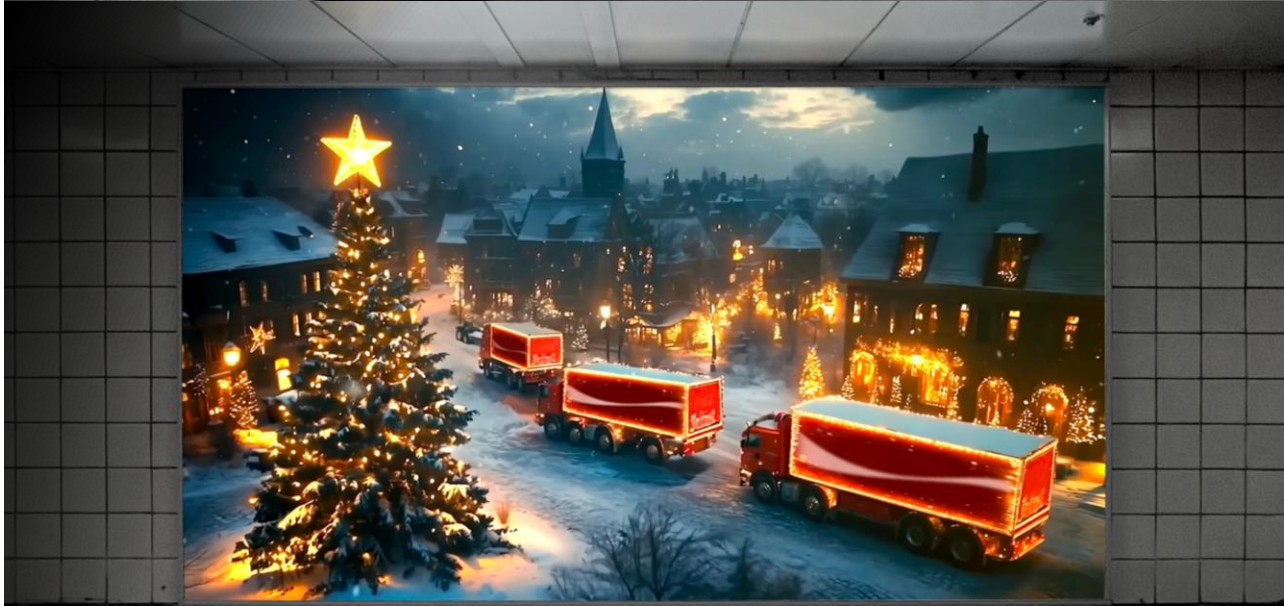
을지로입구 Lightbox B type