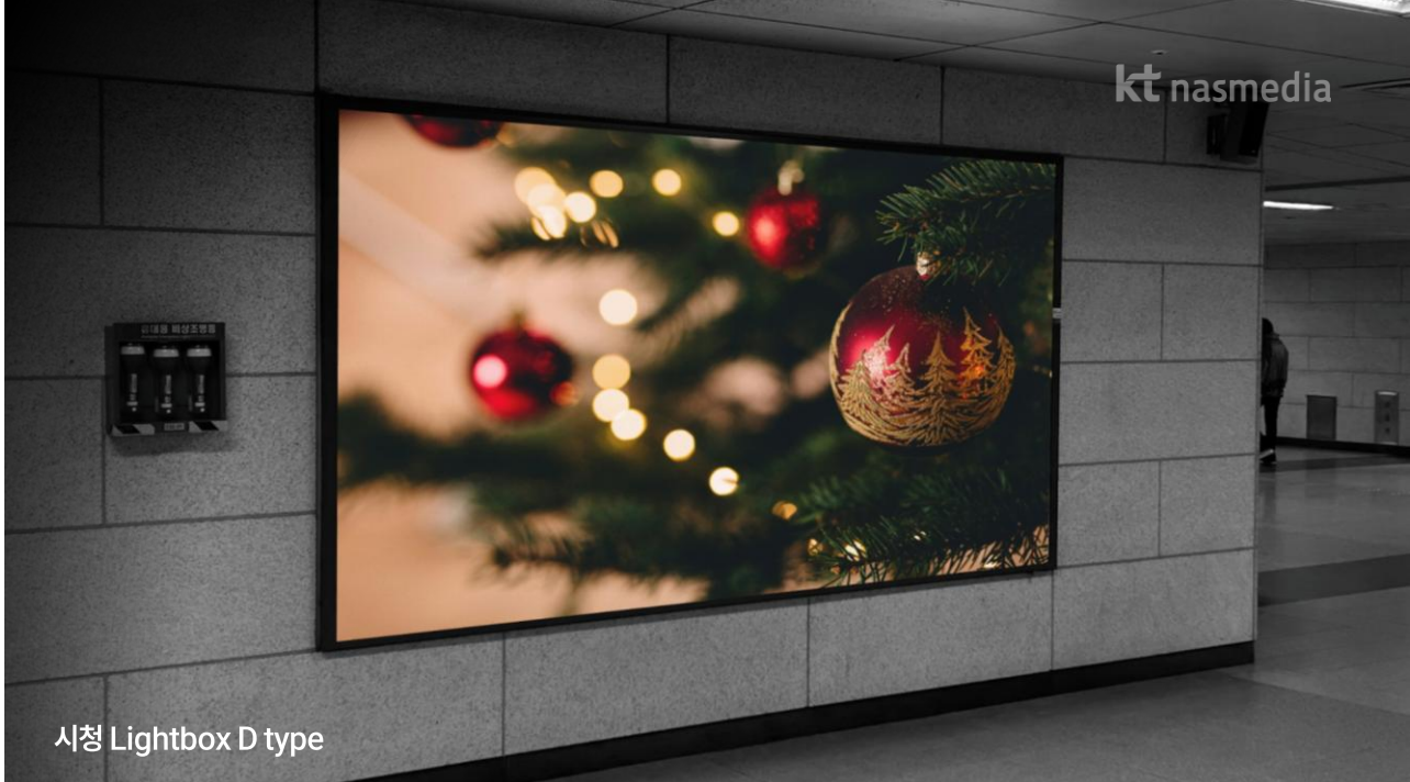
시청 Lightbox D type

* 1개월 집행 기준 / 제작비 별도 / 부가세 별도 * 광고 도안 제작 시 제작가이드 확인 필수 * 역사 별 세부 단가 별도 문의