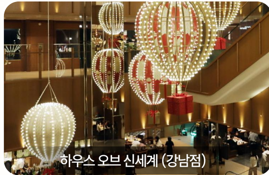
하우스 오브 신세계 (강남점)