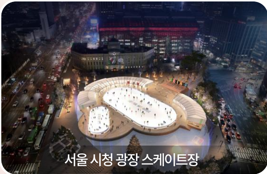
서울 시청 광장 스케이트장

연말 행사와 축제가 집중되는 지역의 인근 역사 중심으로 구성되어, 브랜드 노출 효과를 극대화할 수 있는 패키지입니다.